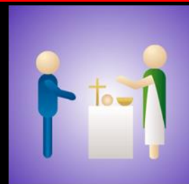
Aclamación Anámnesis y oblación