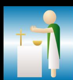
Fracción del pan