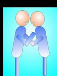
Rito de Paz