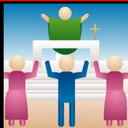
Prefacio Acción de gracias y Santo